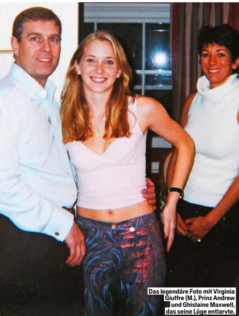
Das legendäre Foto mit Virginia Giuffre (M.), Prinz Andrew und Ghislaine Maxwell, das seine Lüge entlarvte.