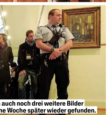
Beim gleichen Überfall wurden auch noch drei weitere Bilder entwendet – zwei davon wurden eine Woche später wieder gefunden.

Nach dem Raub in der Sammlung E. G. Bührle in Zürich wurde das Museum geschlossen. Die Sammlung ging auf eine internationale Tournee und wurde später im Kunsthaus Zürich gezeigt, wo es zu Kontroversen rund um die Herkunft der Kunstwerke kam. Der Dauerleihvertrag mit dem Kunsthaus Zürich ist weiterhin gültig, die Ausstellung ist derzeit aber geschlossen. «Eine neue Präsentation ist in Vorbereitung», erklärt Jolles.