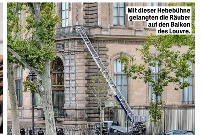
Mit dieser Hebebühne gelangten die Räuber auf den Balkon des Louvre.

Die Schweiz erlebte am 10. Februar 2008 einen spektakulären Kunstraub. Damals wurden bei einem bewaffneten Überfall auf die Sammlung E. G. Bührle in Zürich vier wertvolle Gemälde gestohlen. Die gestohlenen Werke von Monet, Degas, Cézanne und van Gogh waren Millionen Franken wert. Zwei Bilder wurden eine Woche später gefunden – in einem weissen Opel auf dem Parkplatz der psychiatrischen Klinik Burghölzli in Zürich. Die Rückholung der anderen beiden Bilder, darunter der 100-Millionen-Cézanne («Der Knabe mit der roten Weste»), gelang im Rahmen einer filmreifen Aktion der Zürcher Polizei.