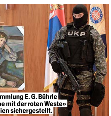
Das 2009 aus der Sammlung E. G. Bührle geraubte Bild «Der Knabe mit der roten Weste» wurde 2012 in Serbien sichergestellt.

Ein Museum müsse also zwischen der Präsentation der Kunst und verschiedenen Gefahren abwägen – Diebstahl, Raub, Wasser oder Feuer. «Wenn man die Werke zu fest montiert, kann man sie im Notfall nicht evakuieren», sagt Jolles. Im Ernstfall sei eine herausgerissene Verankerung egal – die Kunst müsse gerettet werden.