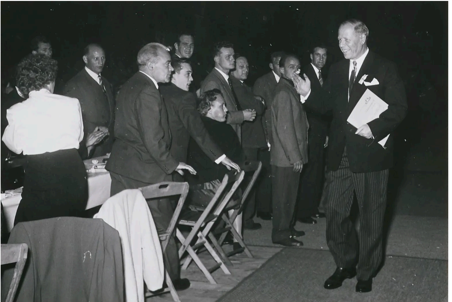
Emil Georg Bührle (à droite) en 1956, l'année de sa mort subite.

clair pour ces deux dernières. Rien ne le deviendra du reste jamais. En accueillant avec des cris de triomphe ce prestigieux ensemble d'impressionnistes formé dans des circonstances troubles, le musée a commis l'équivalent du péché originel. Il a croqué la pomme. Les 203 toiles provenant de la collection d'Emil Georg Bührle sèment le doute. L'industriel germano-suisse ayant vendu des armes aux Allemands pendant la guerre, il ne peut qu'avoir rassemblé que des tableaux spoliés à des familles juives.