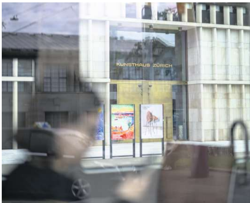
Der 2021 eröffnete Erweiterungsbau ist ein Grund für die finanzielle Schieflage des grössten Kunstmuseums der Schweiz.

Es waren eindringliche Worte, mit denen die Stadtpräsidentin und die beiden Vertreter der Kunsthaus-Trägerschaft am Freitag vor die Medien traten. Die Stadt Zürich will ihre jährlichen Beiträge an die Zürcher Kunstgesellschaft und die Stiftung Zürcher Kunsthaus per 2027 um insgesamt 7,3 Millionen Franken erhöhen. 4 Millionen Franken sollen an die Kunstgesellschaft fließen. Damit steigt die Summe der Subventionen für die Gesellschaft