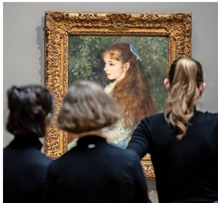
Publikumsmagnet: «Irene Cahen d'Anvers» (1880) von Auguste Renoir. Das Meisterwerk ist Teil der Bührle-Sammlung.