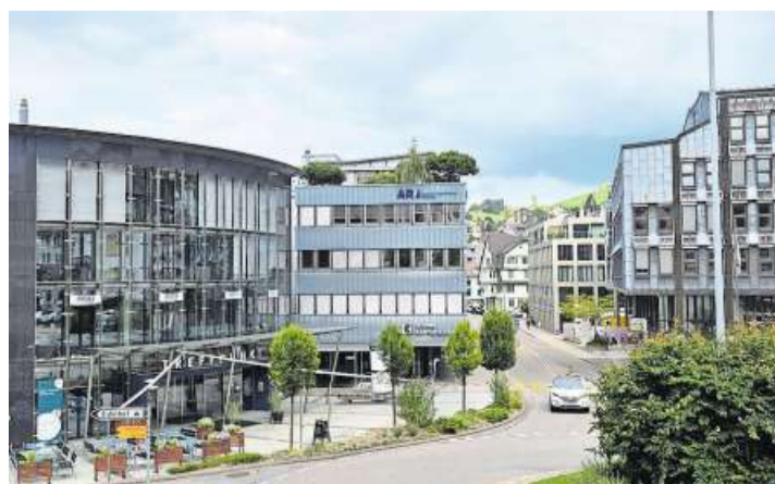
Die Restaurants Treffpunkt (links) und da Marco (im beige Gebäude rechts im Bild) spannen ab 1. November zusammen.

Was viele Herisauerinnen und Herisauer freuen dürfte: