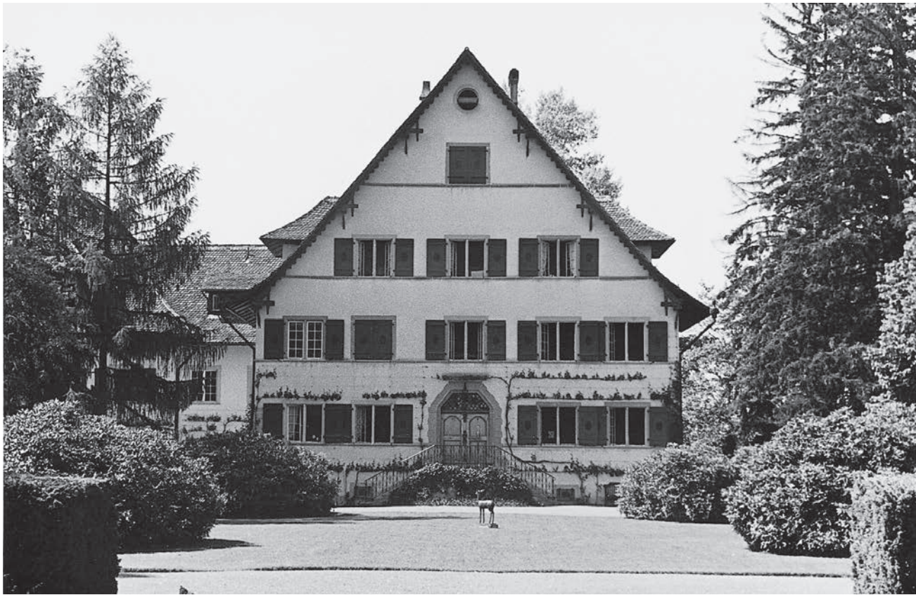
Bocken im Sommer 1941. Das denkmalgeschützte Haus gehört heute der Credit Suisse.

vor dem Ersten Weltkrieg mit politischem Antisemitismus Wahlen gewinnen und Bürgermeister werden konnte.