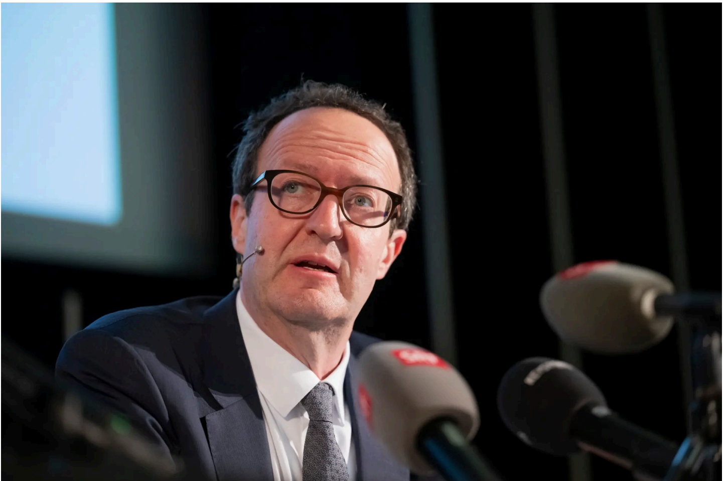
Der Historiker Raphael Gross präsentierte im Juni 2024 seine kritische Beurteilung der Bührle-Provenienzforschung.

Käme bei einem problematischen Bild keine solche Einigung zustande, würde das Kunsthaus dieses künftig nicht mehr ausstellen.